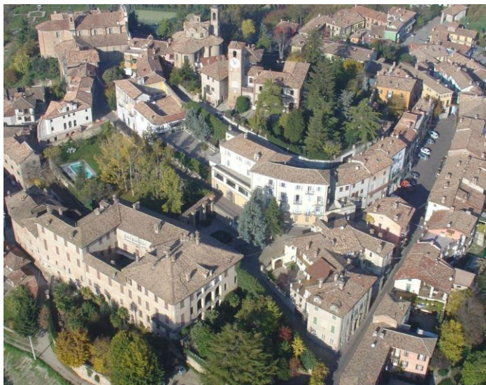
Foto aerea del Comune di Neive