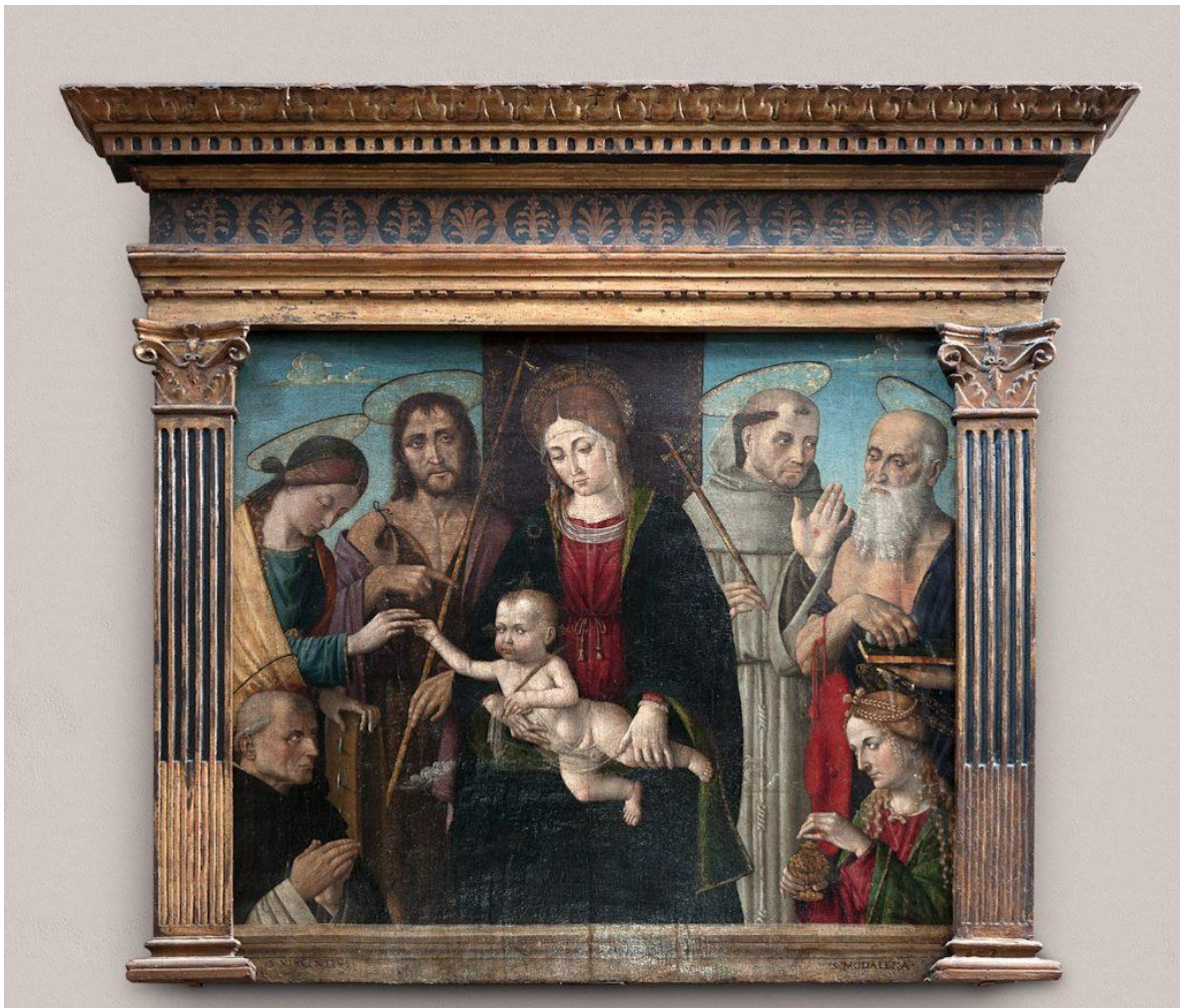
Lo sposalizio mistico di Santa Caterina, Macrino d'Alba. Tempera su tavola

Il quadro raffigura al centro la Madonna che regge un Gesù Bambino intento ad inanellare Santa Caterina di Alessandria, sulla sinistra, simbolo del matrimonio spirituale fra la santa e Dio. Da sinistra verso destra compaiono i santi Giovanni Battista, Francesco, Gerolamo, Vincenzo Ferreri e la Maddalena.