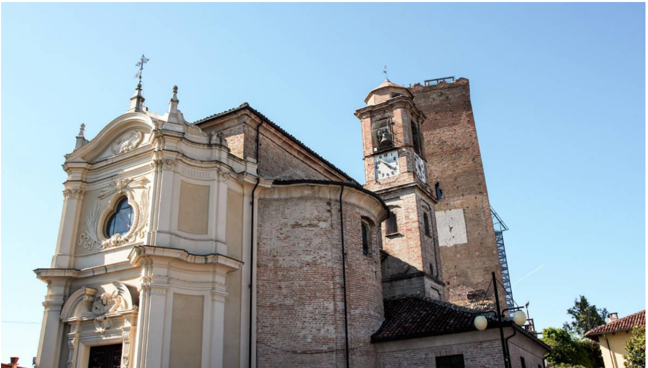
La Chiesa di San Giovanni Battista con, alle spalle, la Torre di Barbaresco

Inaugurata nel 1728, la chiesa è, con il suo altare marmoreo scolpito dal conte Rangone de Montelupo, un sorprendente capolavoro dell'architettura barocca. Affreschi e sculture in legno.